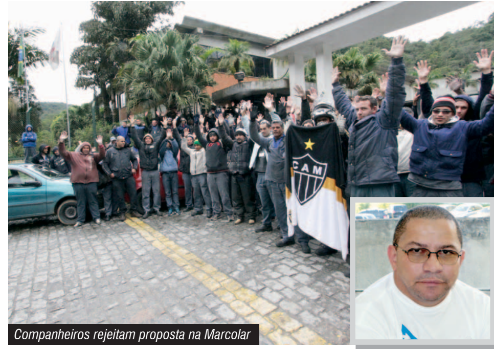
Companheiros rejeitam proposta na Marcolar

A Marcolar contrata hoje cerca de 300 trabalhadores, faz parte do Grupo 8, a atua na produção de painéis e formas.