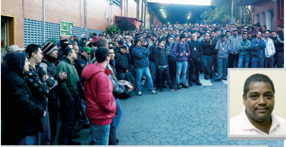
Trabalhadores tomam conhecimento da proposta negociada entre Sindicato e empresa

"Foi essa união de todos que respaldou o