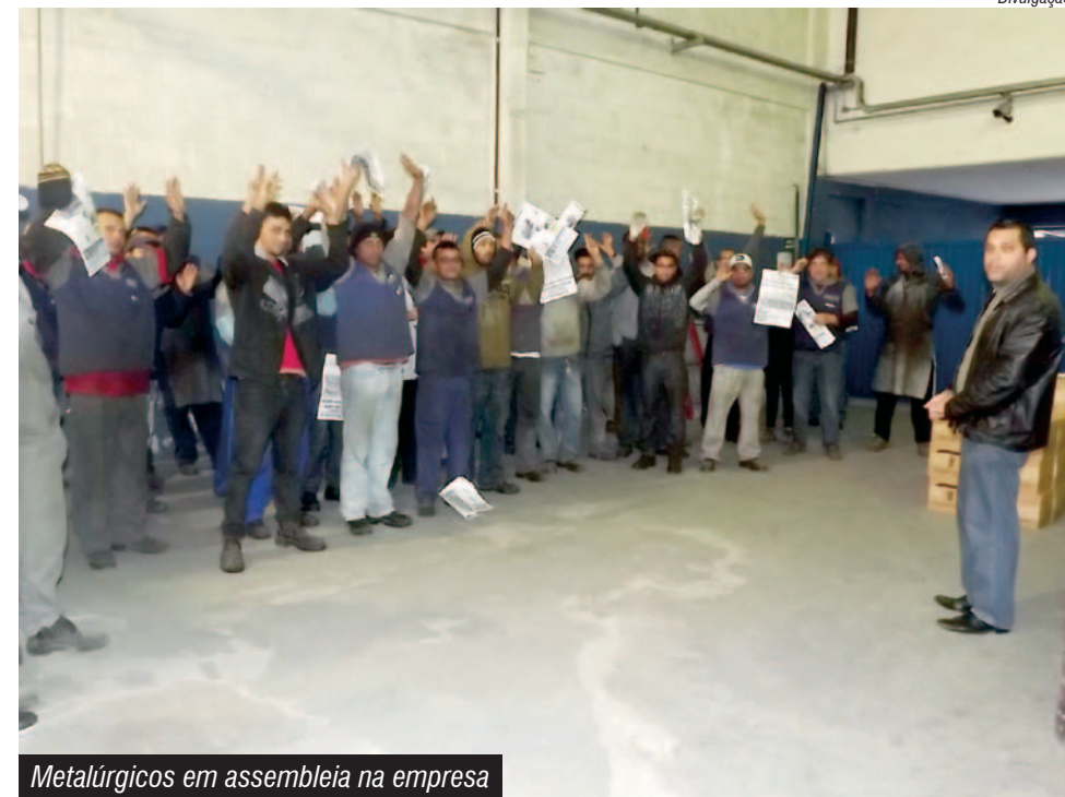
Metalúrgicos em assembleia na empresa

Para a PLR do ano que vem, as datas de pagamento serão em